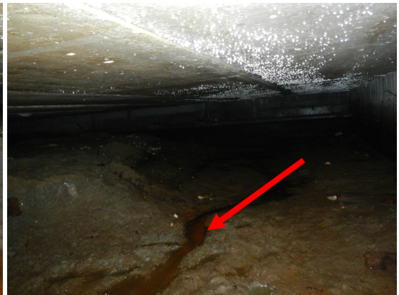
Kuva 4. Seisovaa vettä ruokalatalan alaisessa alapohjassa.