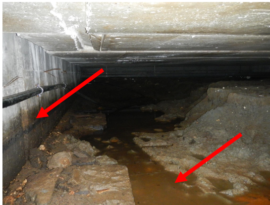
Kuva 3. Seisovaa vettä ruokalatalan alaisessa alapohjassa sekä kastuneita rakenteita.