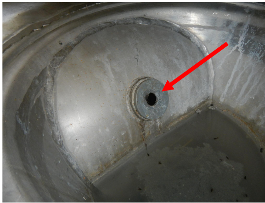
Kuva 1. Keittiön lattiakaivon rikkiäinen rassitulppa.

Alapohjan tarkastuksessa havaittiin rakenteiden olevan kosteat, sekä alapohjassa seisoi hieman vettä ( Kuvat 3 ja 4 ).