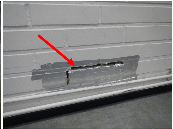
Kuva 2. Rikkoutunut rakenneavauksen paikkaus josta ilma virtaa sisään.