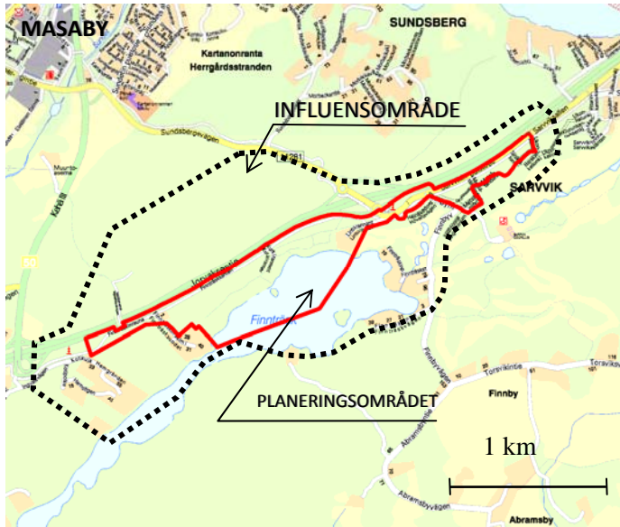
Planeringsområdet för detaljplanen och dess preliminära influensområde

Program för deltagande och bedömning (MBL 62 § och 63 §)